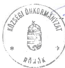
Pékó Tamás Lajos polgármester