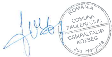
..... Ferencz Csaba polgármester Csíkpaľfalva Község Önkormányzata